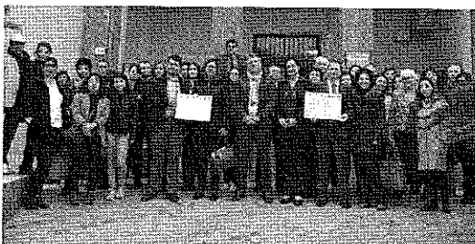
Le delegazioni straniere e gli amministratori davanti al municipio

Nell'aula consiliare del municipio di Sant'Alessio Siculo è stato firmato questa mattina il Patto di fratellanza con Bulgaria, Romania, Spagna e Slovacchia , nell'ambito del progetto europeo di gemellaggio fra città dal titolo "Sharing Solutions for Climate Change: The Voice of Citizens" . L'evento rientra nell'iniziativa di gemellaggio promossa dal Comune attraverso il coinvolgimento attivo con quattro municipalità europee, le cui