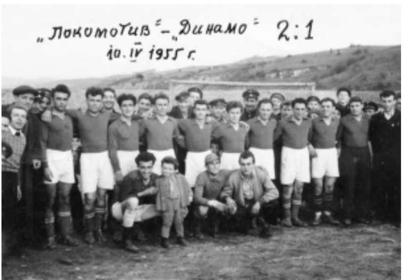
Локомотив (Мездра) - 1955 г.

В рубриката „Спортен фотоархив“ Ви предлагаме две уникални снимки от историята на мездренския футбол.