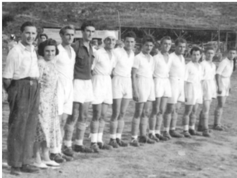
Динамо (Мездра) - 1950 г.