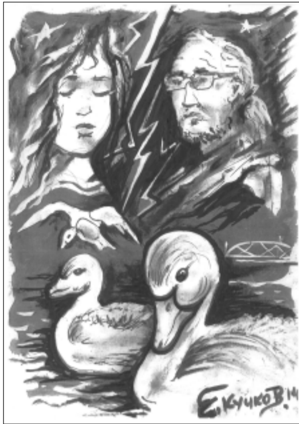
Илюстрация: Евгени КУЧКОВ

- Обещавам, обещавам, но ти откъде знаеш, че ми казват „принцесо“?