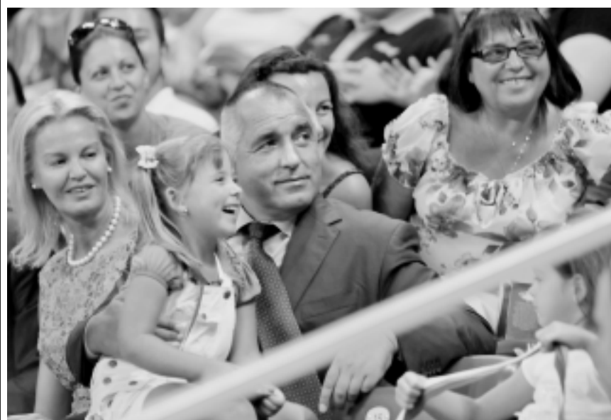
КАЛИНА - 5 годинки