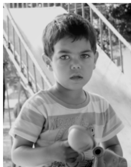
СЕВЕРИН - 3 годинки