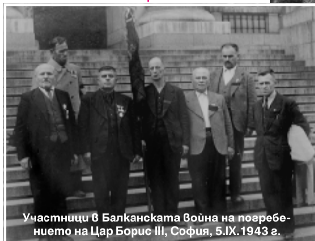
Участници в Балканската война на погребението на Цар Борис III, София, 5.IX.1943 г.

войници и подофицери от 28-те населени места в община Мездра . Най-много са мобилизираните от Люти гол - 286, Лик