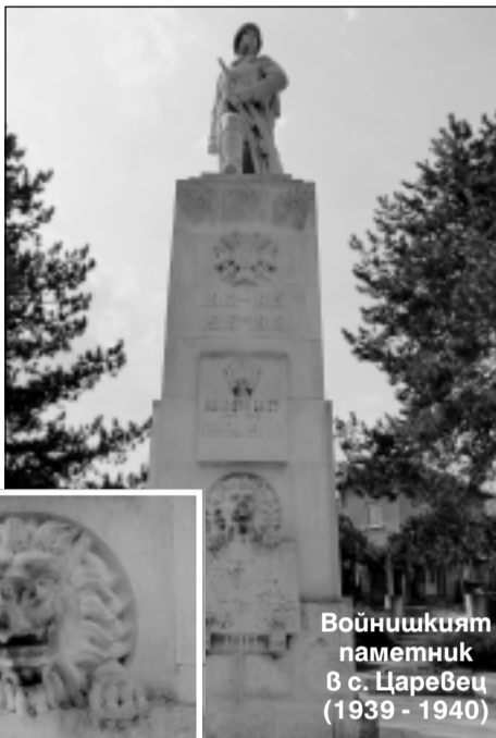
Войнишкият паметник в с. Царевец (1939 - 1940)