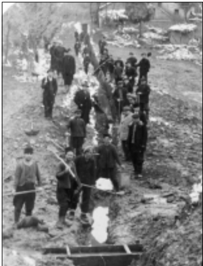
Изграждане на чешмата в с. Горна Бешовица