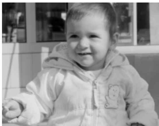
КАЛИНА 1 годинка