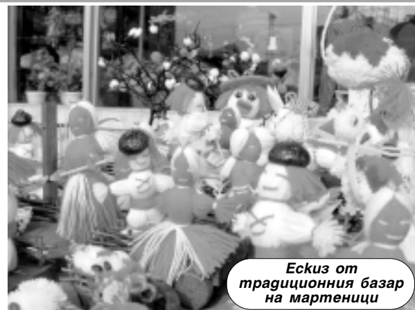
Ескиз от традиционния базар на мартеници