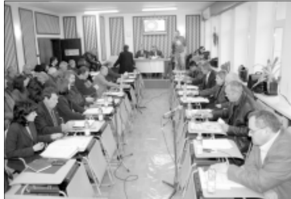
Общинският съвет прие Бюджет 2010 (Решенията - в следващия брой)

хора с различни видове увреждания и самотно живеещи хора“, реализиран по Оперативна програма „Развитие на човешките ресурси“. С преходната статуетка бе отличена практиката на Община Козлодуй „Информационно издание „От и за Общината“, а трето място зае проектът „Прозорец към света“ на Община Ловеч. В другата категория, в която участвахме - за „Най-прозрачна общинска администрация“, приза получи Община Добрич. Награждането се състоя на 18 февруари в Пловдив по време на XXI Общо събрание на Националното сдружение на общините в Република България.